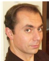
Graziano Chesi 教授 中国香港大学